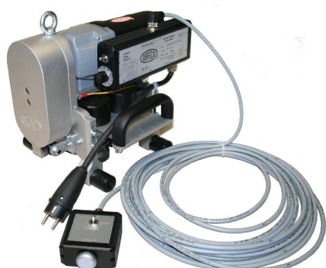
mit optionaler Kabelfernsteuerung K9-1-KF

Die optionale Kabelfernsteuerung K9-1-KF hilft beim rationellen Schließen von Fassaden. Das Gerät kann von einem sicheren Standpunkt aus durch den Bediener wieder zum Ausgangspunkt zurückgefahren werden ohne sich zum Gerät begeben zu müssen = zusätzliche Sicherheit am Bau.