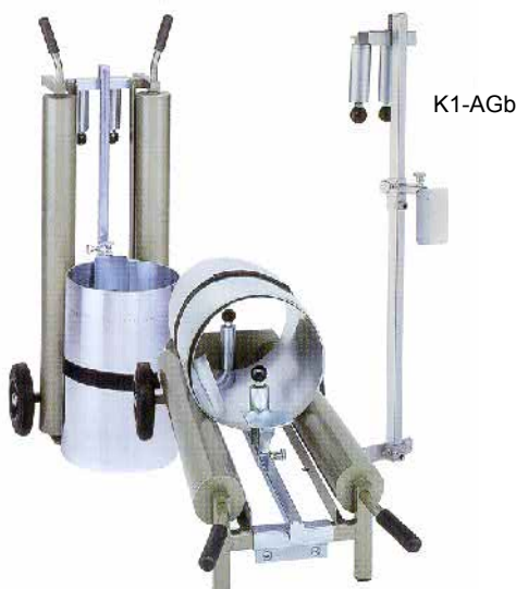
K1-AG mit K1-AGb